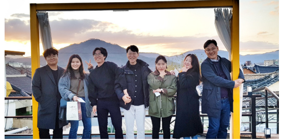
국내의 도시재생 사례 탐방