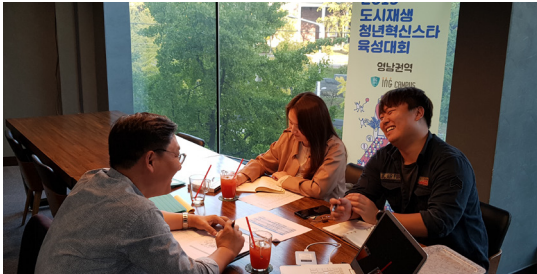
지역 도시재생 센터 간 자원 연계