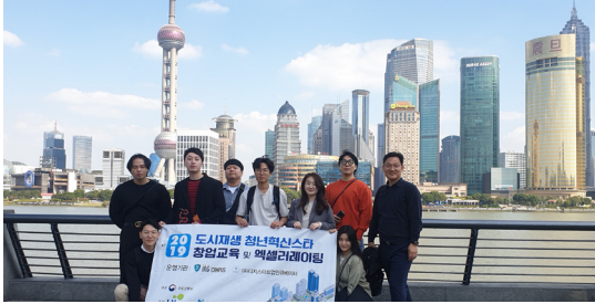
국내의 도시재생 사례 탐방