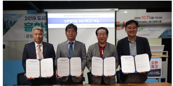
지역 도시재생 센터 간 자원 연계