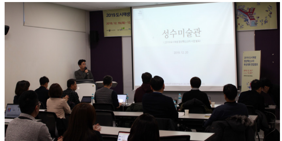
IR 역량 강화 코칭프로그램